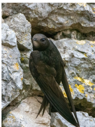
A l'entrée d'un nid

Les martinets noirs vivent en colonies de plusieurs dizaines d'individus. On les remarque facilement à partir du mois de mai en ville grâce à leurs rondes folles, surtout composées de jeunes immatures, où ils rasant les toits des immeubles en poussant leurs cris stridents.